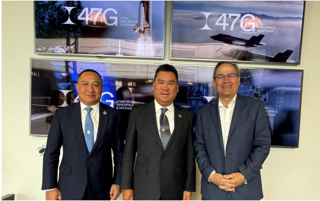
ภาพข่าวประชาสัมพันธ์เพิ่มเติม